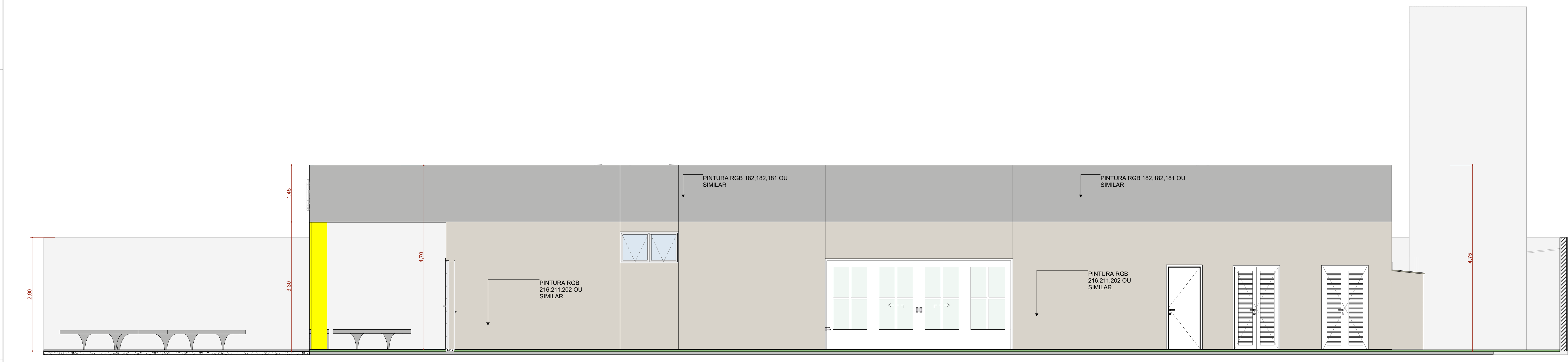
F4 FACHADA DIREITA Escala: 1:50